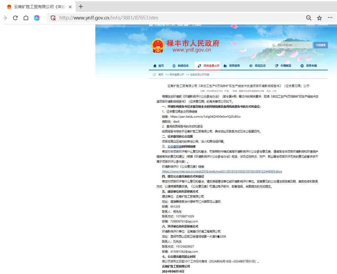
图3 第二次网络公示截图