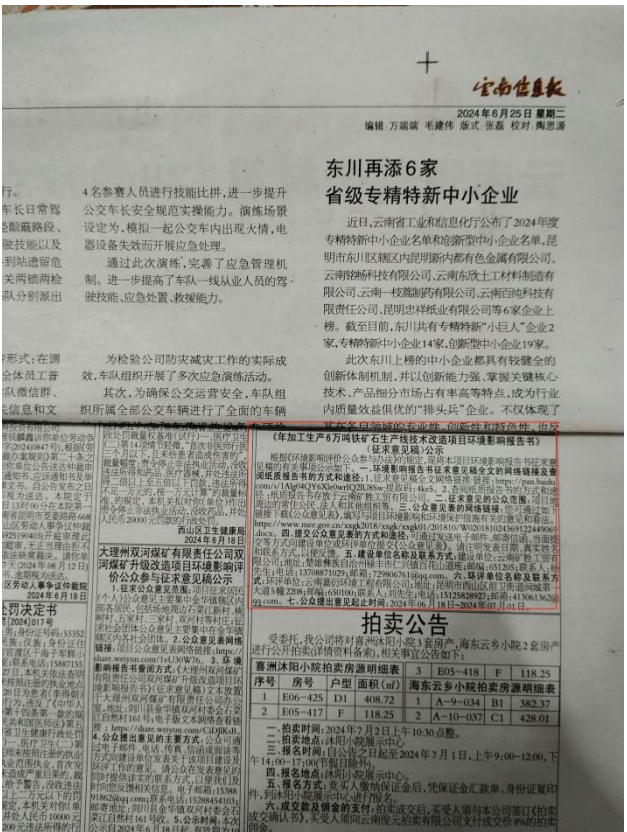
图3 两次登报公开照片