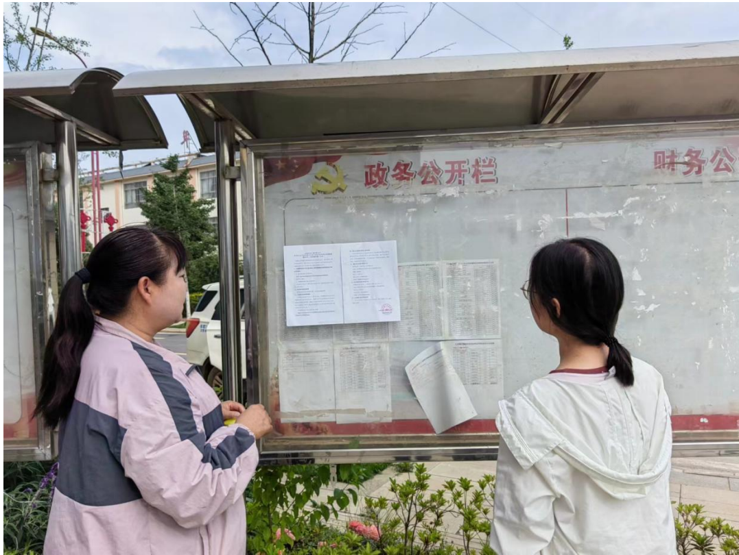
图 4 张贴公告现场照片