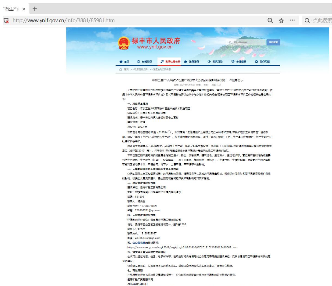
图 1 第一次网络公示截图

http://www.ynlf.gov.cn/info/3881/85981.htm