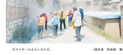
图为乡干部一起整治人居环境。

武定县农村人居环境整治提升行动,按照“宜水则水、宜旱则旱”原则,推行“一户一厨”个性化改造模式,试验推广“新型节水冲厕所水厕处理难题”。全县累计新建农村卫生厕所20553座,免水冲卫生旱厕50座,以上较大自然村卫生公厕实现全覆盖,合格率达100%。