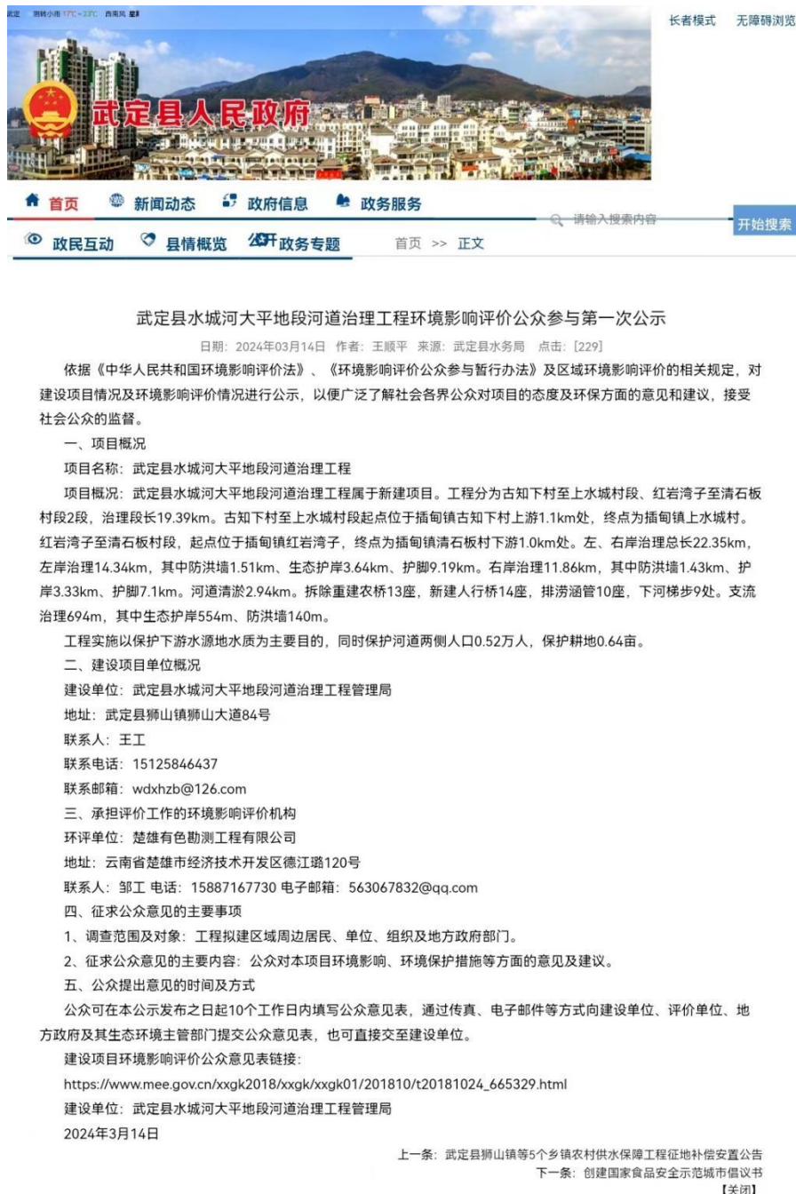
图 2-1 第一次网站公示截图