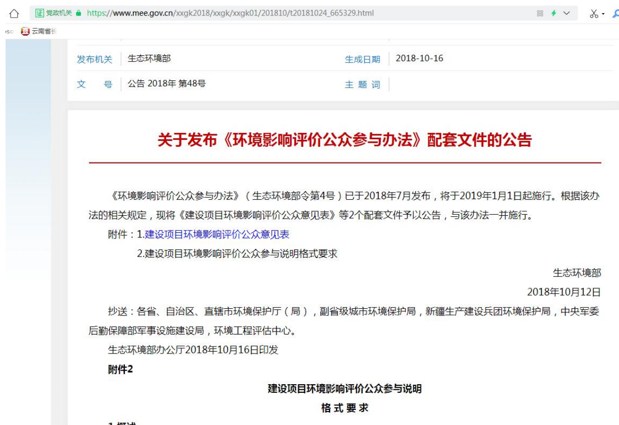
图 2-2 公众意见表网络公示截图