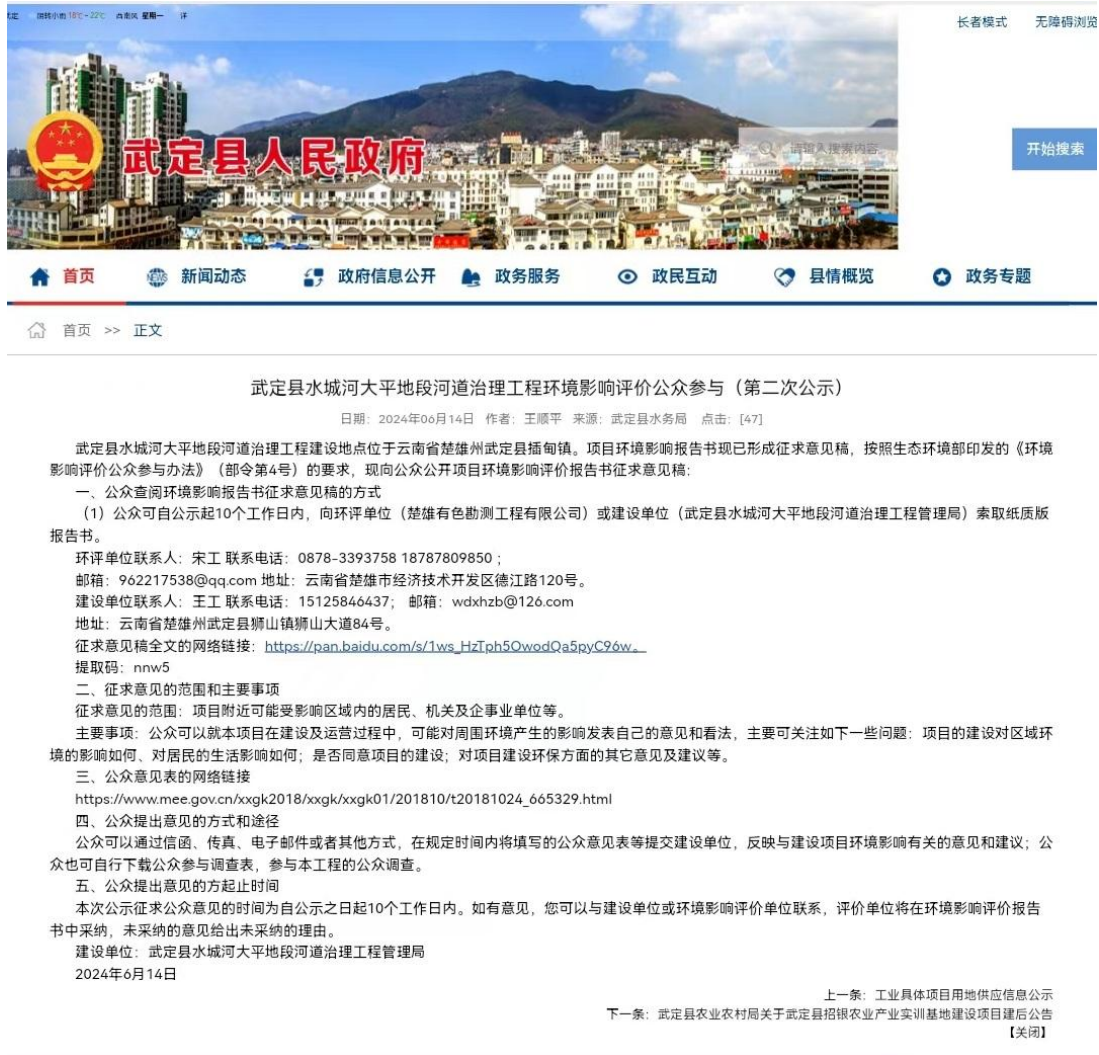
图 3-2 第二次网络公示截图