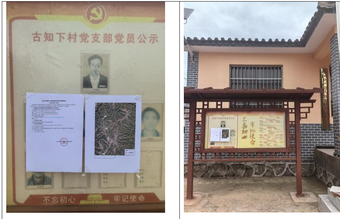
图 3-1 插甸镇古知下村公示栏张贴第二次公示照片